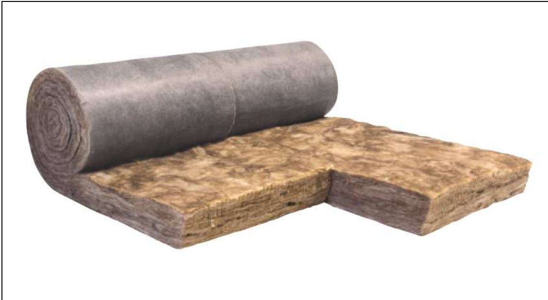
Knauf Insulation laine de verre ECOSE® SmartFaçade 32 R 160 mm